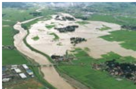
関川の決壊(妙高市月岡)

全国各地で洪水が激化・頻発する中、家族で「7.11水害」の経験を話し合ってみませんか。そして、今、未来に起こり得る水害に備え、「どうやって洪水を知る?、危なくなったらどこへ逃げる?」など、命を守る行動を決めておきましょう。