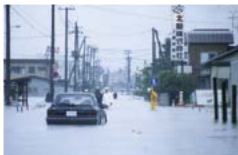
道路の冠水(松村新田)